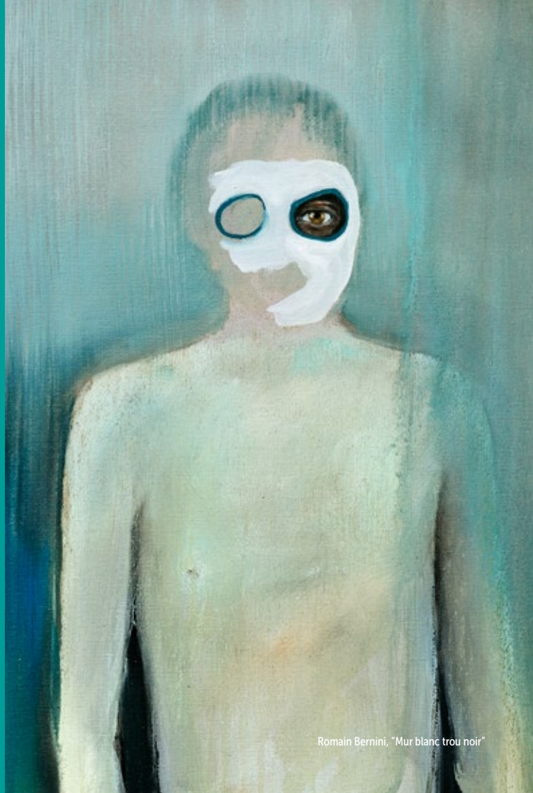
Romain Bernini, "Mur blanc trou noir"